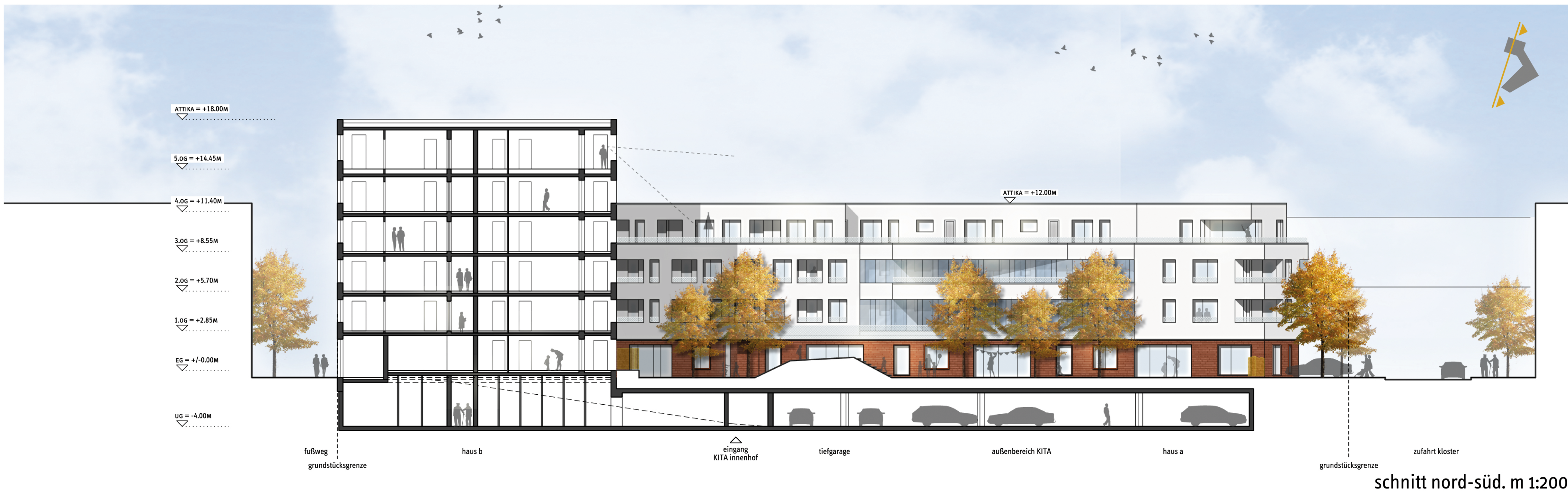
schnitt nord-süd. m 1:200