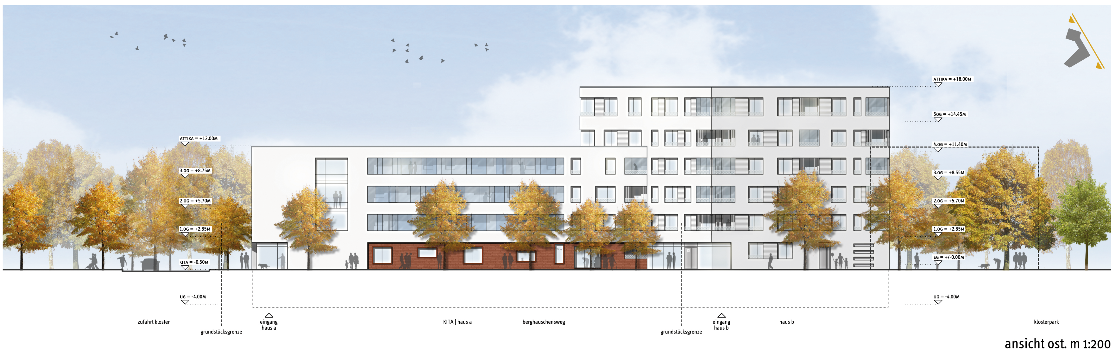
ansicht ost. m 1:200