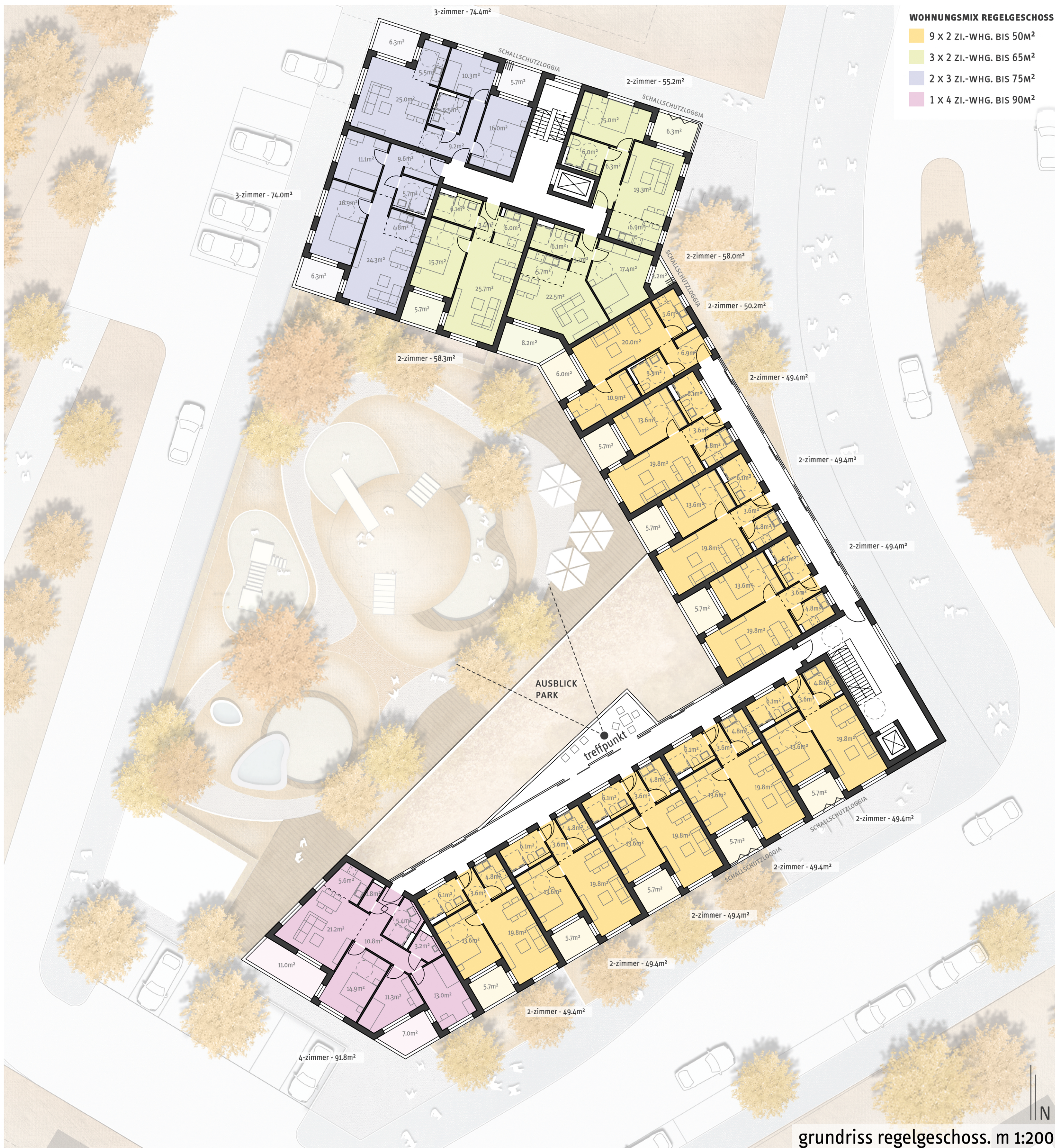
grundriss regelgeschoss. m 1:200