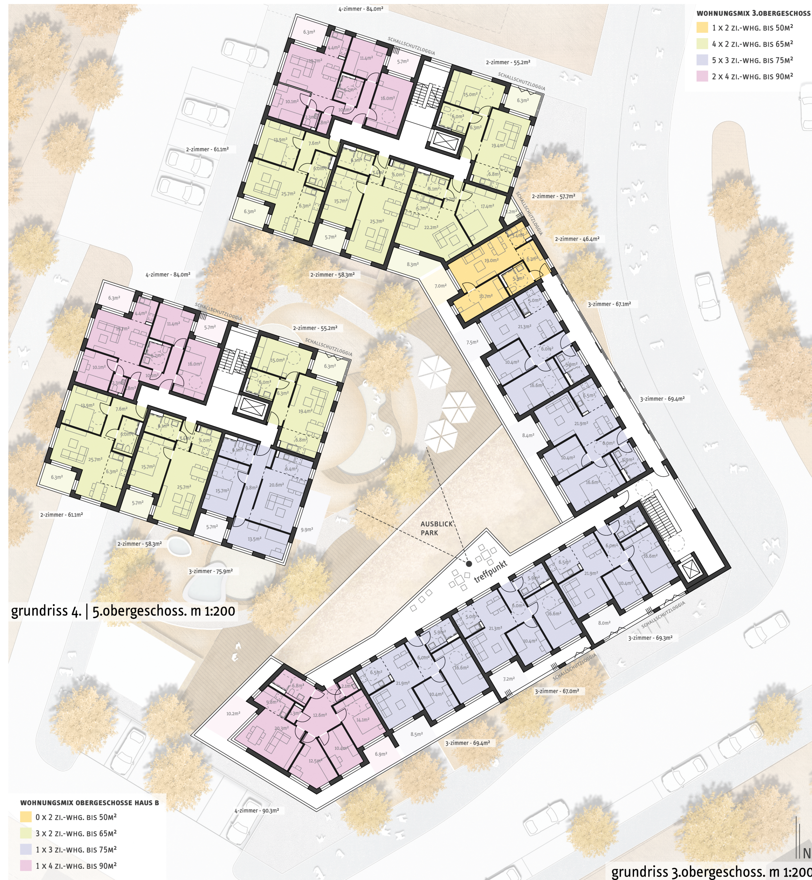
grundriss 4. | 5.obergeschoss. m 1:200